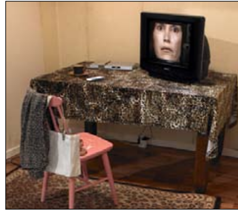
„Lorna“ – interaktive computerbasierte Installation 1983