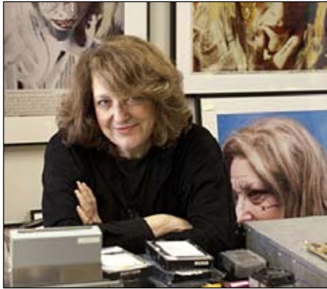
Preisträgerin Lynn Hershman Leeson