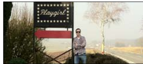
Weserbergland: Projektmanager und Landstrich

erste Begegnung mit der Agentur beschreibt sie als „Liebe auf den ersten Blick“. Das kann LOHNZICH nur erwidern und freut sich, ihr Talent und ihre positive Energie für die Kreation gewonnen zu haben.